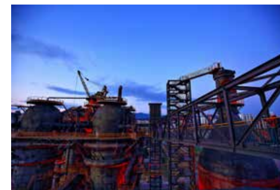
火红的年代