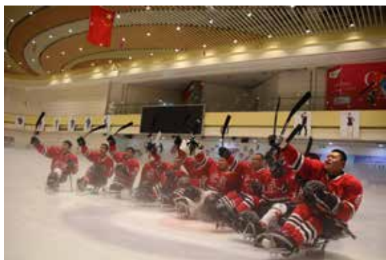
祖国!加油!

活动从发起、组织比赛、专家评选,到举办摄影作品展,共历时6个月。100余名摄影爱好者投稿1000余幅作品,以独特的视角拍摄并反映了备战冬残奥会的生动画面。展览于12月1日在北京西城区第一图书馆开幕。