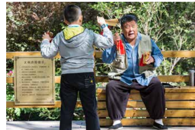
景山公园一角，一位老人正向一位10岁左右的学子耐心传授快板曲艺术。老艺人时而舞动竹板示范，时而悉心传授说唱技巧，示范传神，风趣幽默。