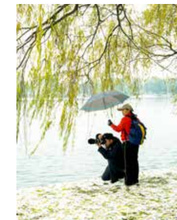
玉渊潭公园，一对夫妇冒着飞雪进行摄影创作，女性撑起了“整片天”。