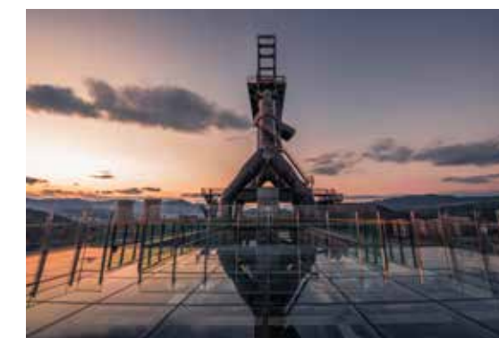
高炉暮色