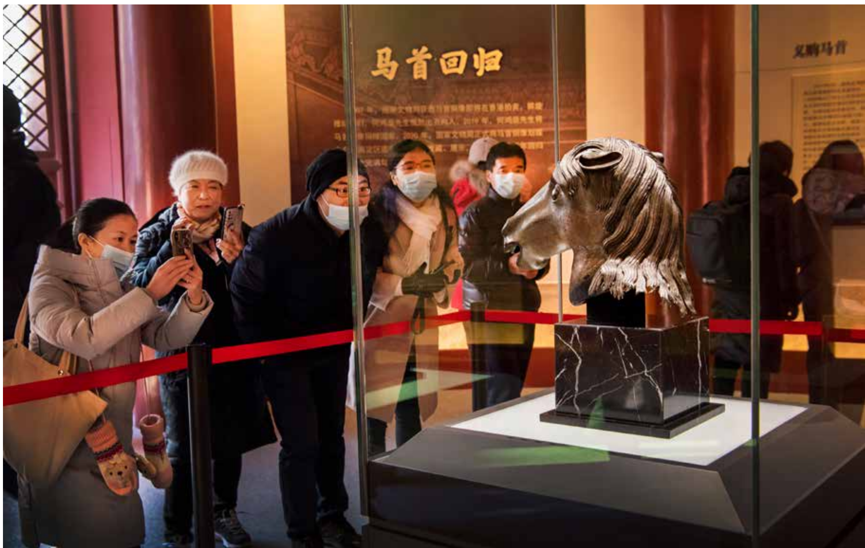
流离了160年之后，圆明园马首铜像正式入藏圆明园正觉寺，成为第一件回归圆明园的流失海外重要文物。大量观众前往参观，一睹马首的风采。