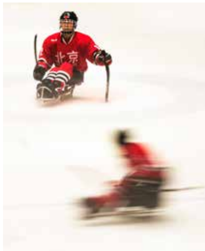
猛虎下山