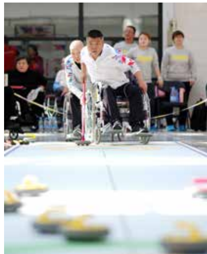
关键一击