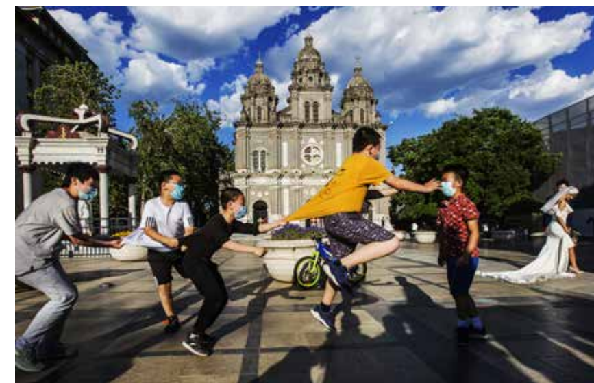
疫情缓解后，孩子们在王府井教堂前开心地玩耍，一对新人也来到这里拍照。疫情下的城市，逐渐恢复了生机与活力。