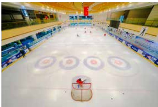
冬奥残疾人运动员训练掠影