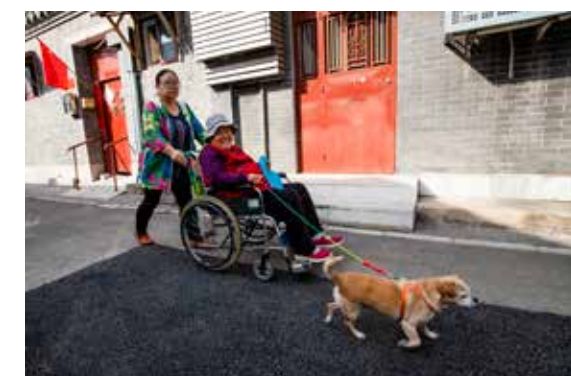
前门陕西巷胡同，一位中年妇女推着老人，老人牵着心爱的小狗，好似一家人出行。