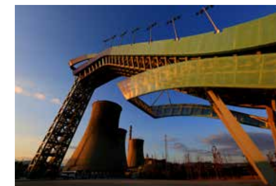
首钢新姿