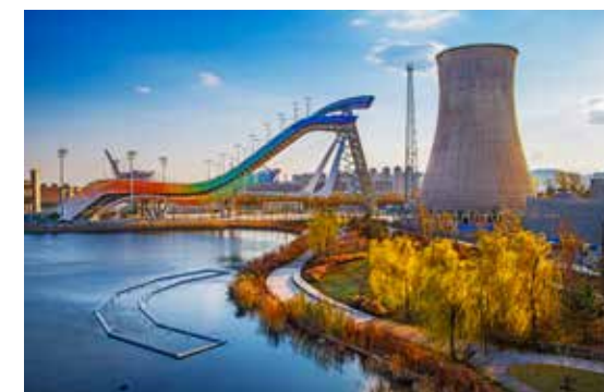
钢城新景