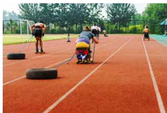
奔向未来