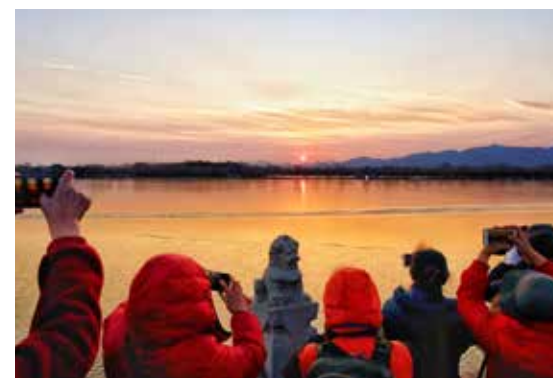
冬至时节，颐和园西堤的落日美景吸引了众多游人拍照留影。