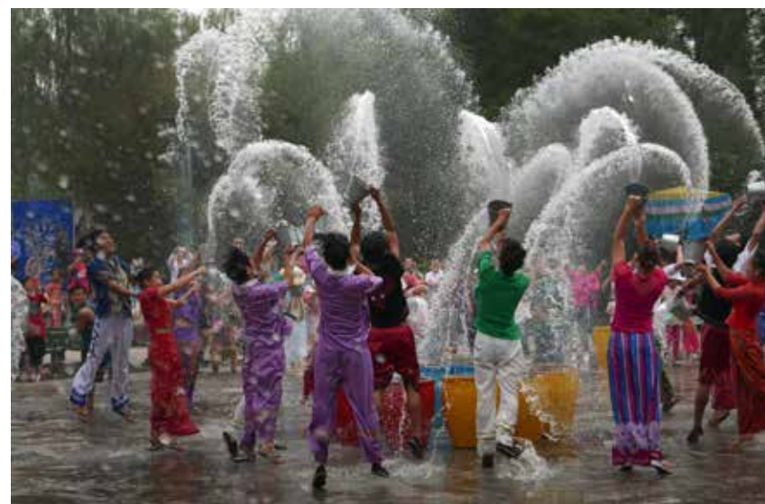
中华民族园每逢四月傣族泼水节，来自全国各民族的员工和游客一起进行泼水欢庆。他们大部分来自贫困地区，然后回到家乡继续发展文化旅游产业，助力家乡脱贫。