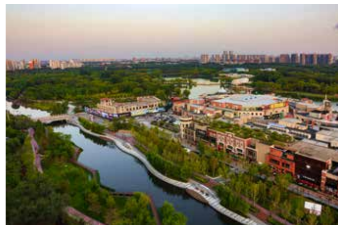
亮马河景观廊道工程完工后，打造成了集生活休闲、国际交流、商业活力、自然生态于一体的国际风情水岸，为朝阳增添了一份新的美丽。