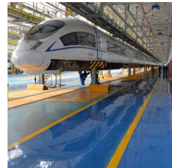
北京动车段，几百米长的高铁车厢被整体托起，各专业工种从上到下对动车进行检查修理，走行转向架轮对被全部移除，分解探伤检修。