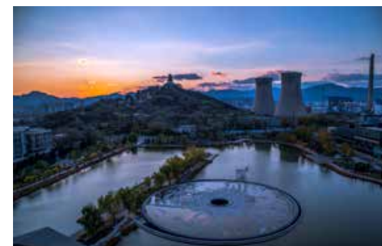
百年钢厂大变样

时间,除了给首钢留下了众多荣誉,也为它锤炼出了迷人的气质。随着首钢的搬迁,老工业区在打造新时代首都城市复兴新地标的构想与实践,展现出了全新的活力。冬奥组委入驻、建设冬奥项目滑雪大跳台、举办冰壶世界杯总决赛、建设国家体育产业示范区等,打造出了兼具形神的后工业文化体育创意基地。