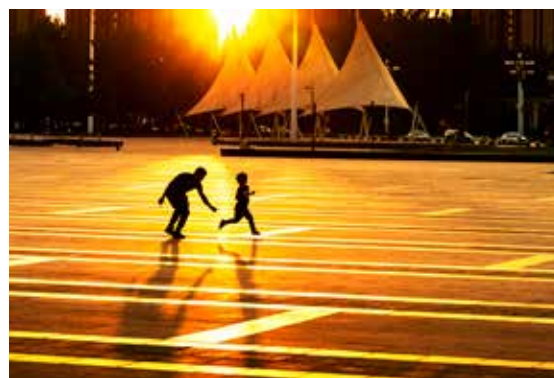
榆堡广场，一对父子在落日的余晖下尽情嬉戏，欢声笑语回荡在广场上空。