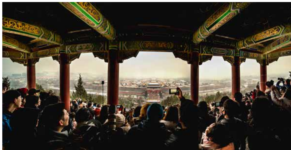
站在万春亭上向南俯瞰，故宫博物院的全景尽收眼底。这里常常聚集着大量摄影爱好者，端着各种不同的相机，以不同的角度猎取北京皇家宫殿最美的视觉瞬间。