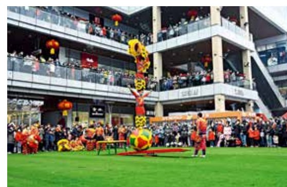
春节期间，北京房山某商城上演精彩舞龙表演，吸引了众多游客观看。