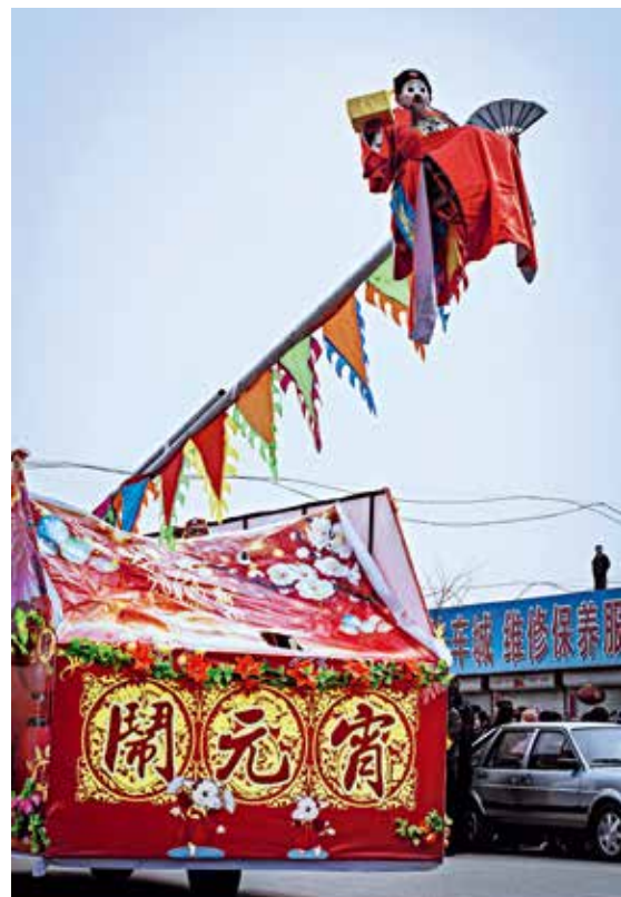
“坐晃”是春节闹社火必不可少的节目