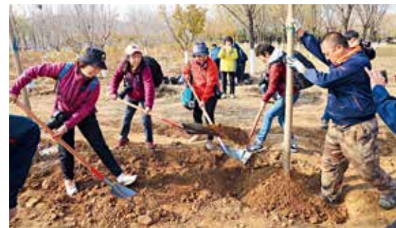
怀柔互联网+义务植树基地植树