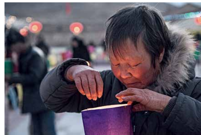
做灯、摆灯、点灯，村民自觉认领完成