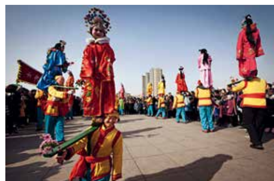
背阁、扛阁的人们兴高采烈，在场地中心转圈展演