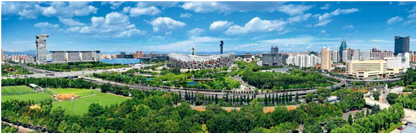
绿色尽染奥林匹克中心公园

为纪念中国共产党成立100周年和全民义务植树活动40周年,践行习近平“绿水青山就是金山银山”的理念,宣传北京生态环境建设成果,让更多市民投身到绿化建设中来,推进全民义务植树运动深入开展,由北京绿化基金会、北京摄影爱好者协会、北京市园林绿化局宣传中心共同主办的2021第二届“共建美丽北京 共享绿色生活”主题摄影展作品征集活动,现已面向全市摄影爱好者征集稿件。