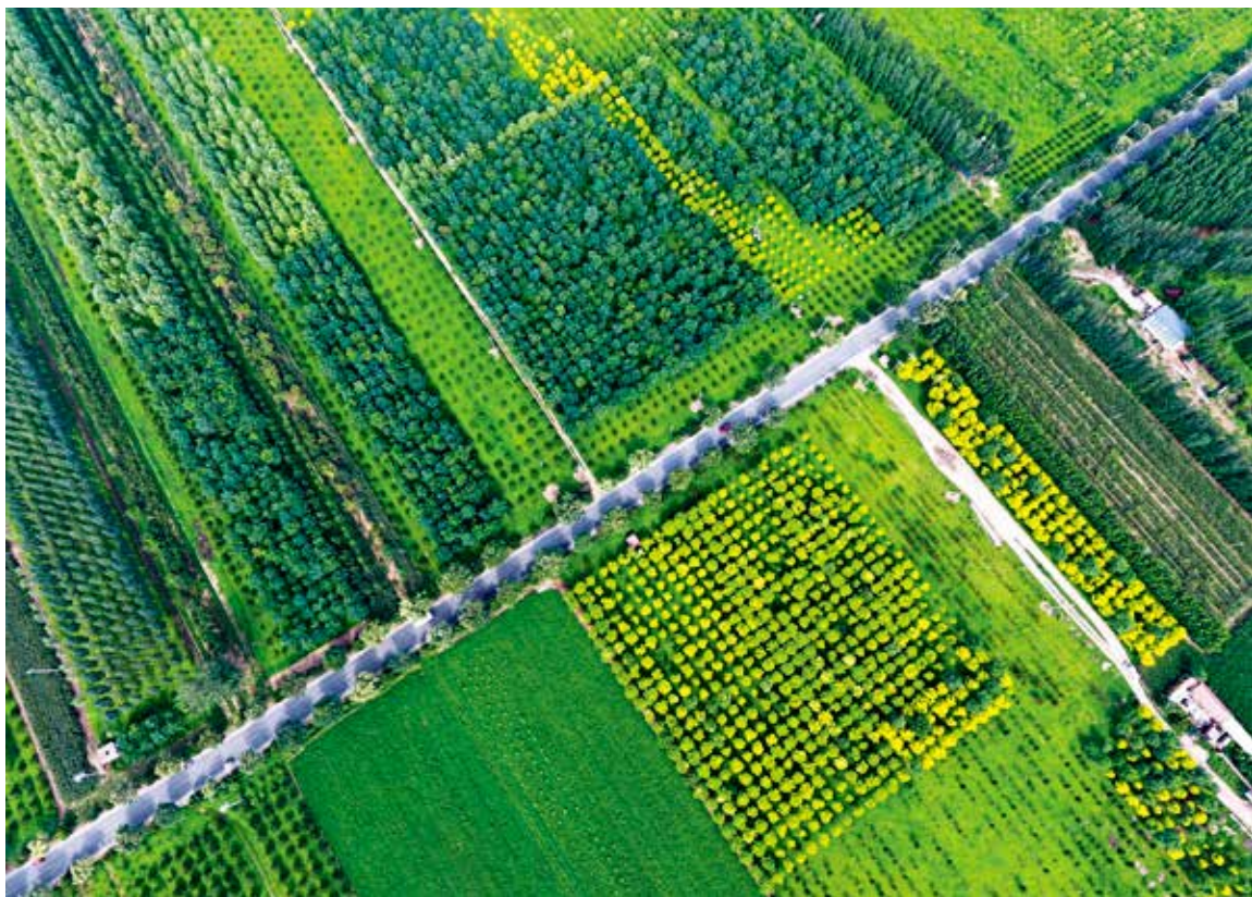
平原造林