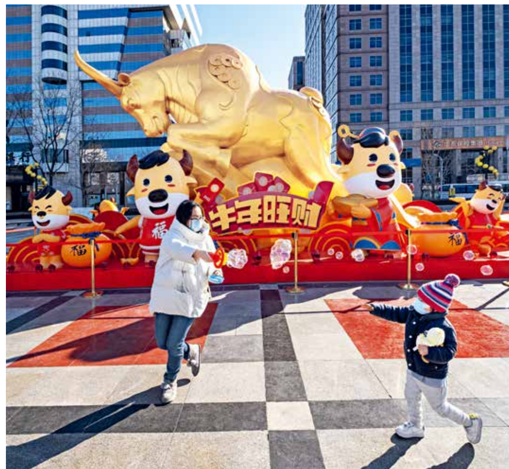
金融街，一位大姐和一个小朋友经过金牛雕塑。巨大的金牛俯首扬蹄，“牛年旺财”四个大字装扮其间，很是壮观。