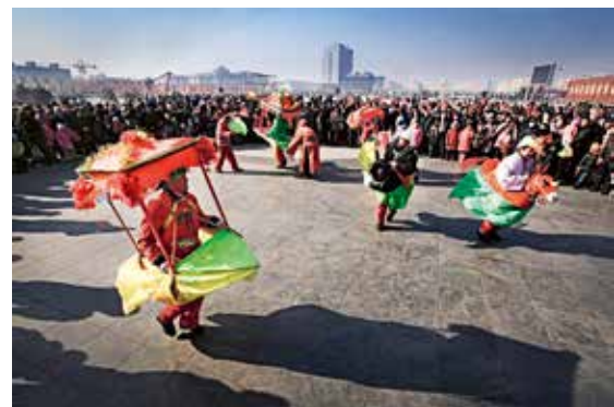
蔚县文化广场上的社火活动