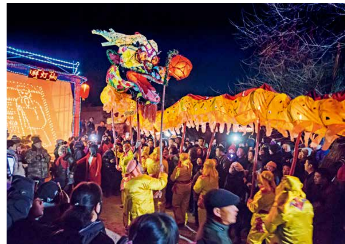
拜灯仙后的逗火龙