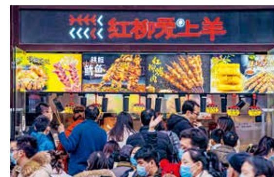
今年春节，广大市民和外来务工人员响应号召就地过年，节日市场人头攒动。