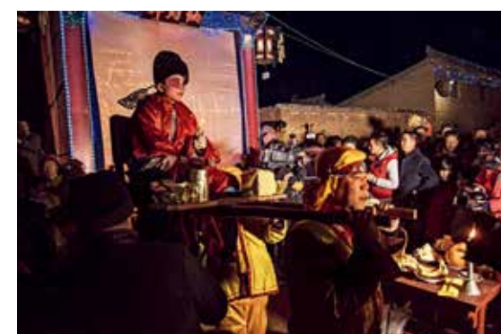
抬出灯官开始祭拜