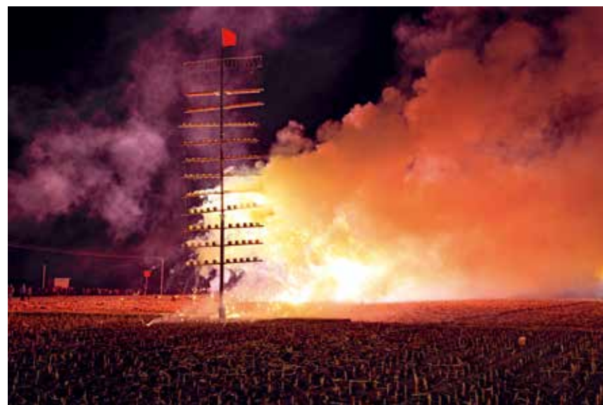
代王城镇燃放烟花点灯杆“祭雷神”

每层上绑有不同的花炮，由下至上逐层燃放，再配以四周“丰斗”、“紫金树”、地面和空中五颜六色的烟花，异彩纷呈，祈求当年不受雹灾，风调雨顺，五谷丰登。