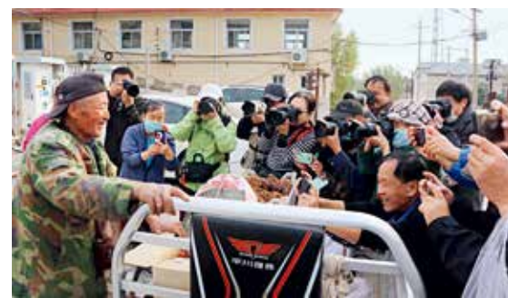
美丽乡村平谷大东沟外拍

2020年是全面建成小康社会和“十三五”规划的收官之年，首都北京奋力谱写实现中华民族伟大复兴的中国梦的北京篇章。为记录和展现北京城市发展的丰硕成果，北京摄影爱好者协会在“筑梦小康 幸福北京”群众摄影文化活动中，组织开展了丰富多彩的摄影采风活动，用摄影的艺术语言记录下光辉时代的缩影。