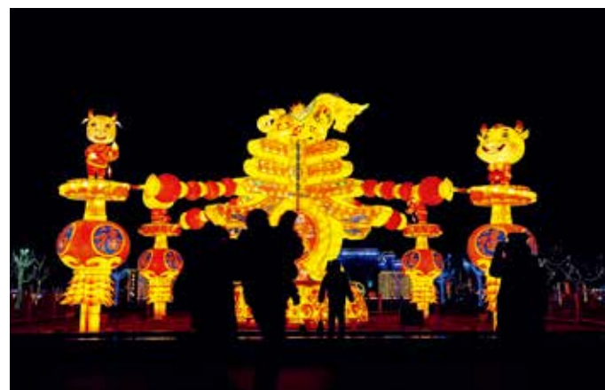
平谷区世纪广场灯展璀璨，喜迎新春，百姓高高兴兴前来参观游玩。