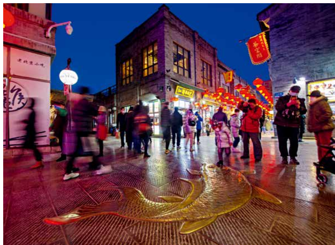
大年初五，著名的北京鲜鱼口胡同，很多留京过年的人们在喜庆的节日氛围中品味着古老的北京文化。