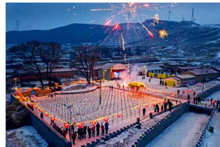
夜幕降临，点灯、祭灯神、转灯阵