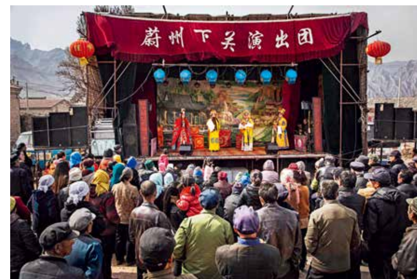
宋家庄镇邢家庄村大戏台