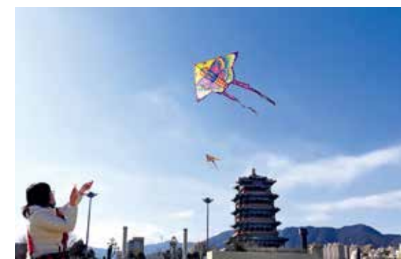
春节假日，在北京门城湖畔休闲广场，明媚的阳光下，市民户外放飞纸鸢，迎接新春。