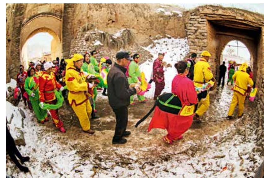
南杨庄乡东大云哩社火队走村串户给村民拜年