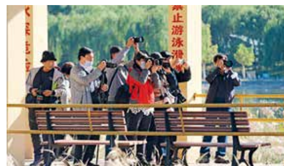
潮白河森林公园外拍