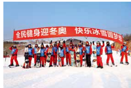
全民健身迎冬奥