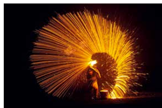
暖泉镇天下奇绝打树花的精彩瞬间

蔚县，古称蔚州，又名萝川，是古燕云十六州之一，至今已有3000多年的历史。悠久的历史，灿烂的文明，不仅打造出了蔚县令人惊叹不已的人文景观，也形成了独特的社火文化。近十年，我常在春节期间游走于蔚县的古堡深处，赏阅那迷人的社火风情。每年正月里，县城、暖泉镇、宋家庄镇、南留庄镇等地，背阁、扛阁、坐晃等各种社火活动热闹非凡，充满着浓郁的节日气氛。