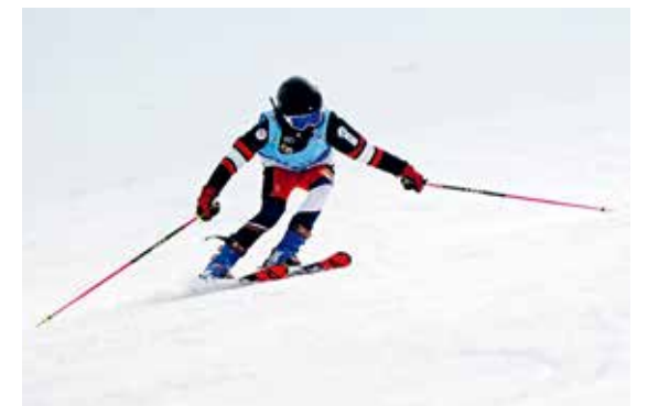
2021北京青少年滑雪队集训