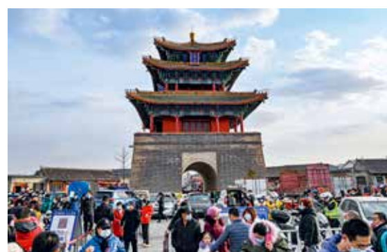
延庆永宁古城，春节期间天天大集，许多住在城里的人们也远道而来，享受过年的喜庆气氛和欢乐场景。