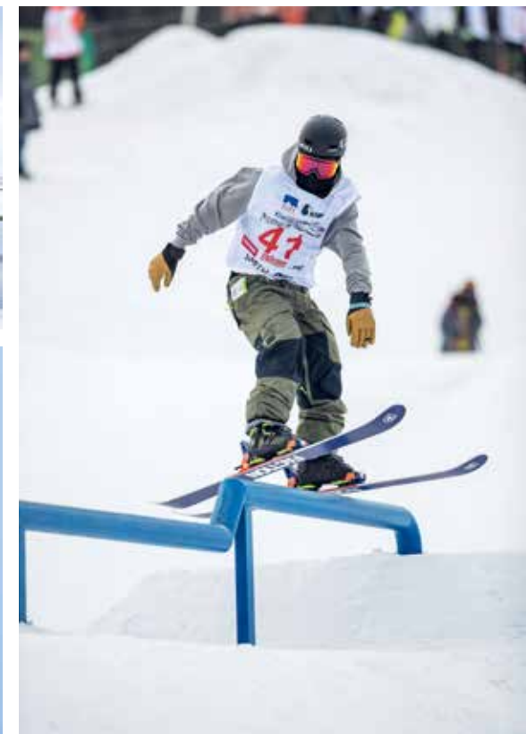
冰雪健儿(组照)