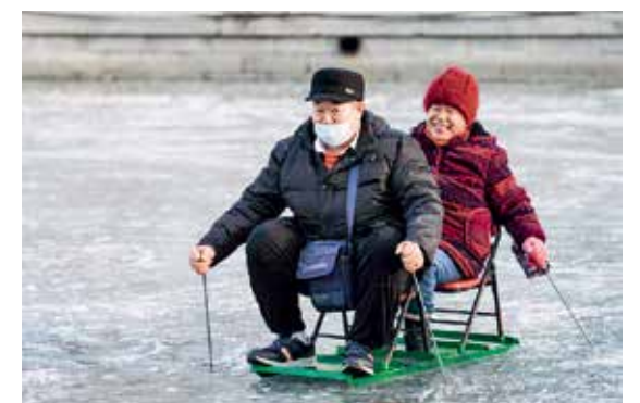
童年的回忆