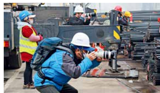
丰台站改造工程外拍