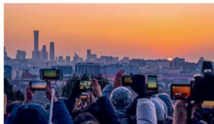
新年伊始，人们在景山上远眺，迎接第一缕阳光，古老的紫禁城与现代化的北京城新貌尽收眼底。