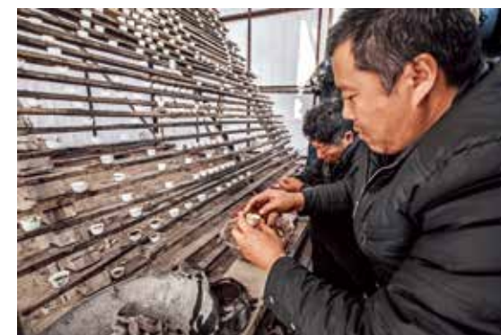
艺人用720个灯盏摆出祭拜的神仙图

蔚县的社火文化，穿越了几百年的历史，象征着蔚县人民对美好生活的向往与希望。社火中国年，北方民俗情，讲述着一段段精彩的春节故事！