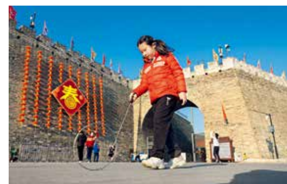
古老的城墙，喜庆的灯笼，大红的“春”字，穿红袄的小姑娘推铁环……让人想起儿时的“年”。