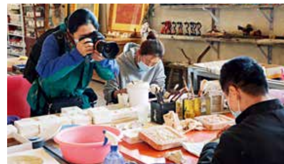
门头沟1958文创园外拍