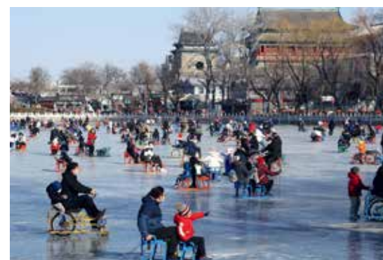
三九时节