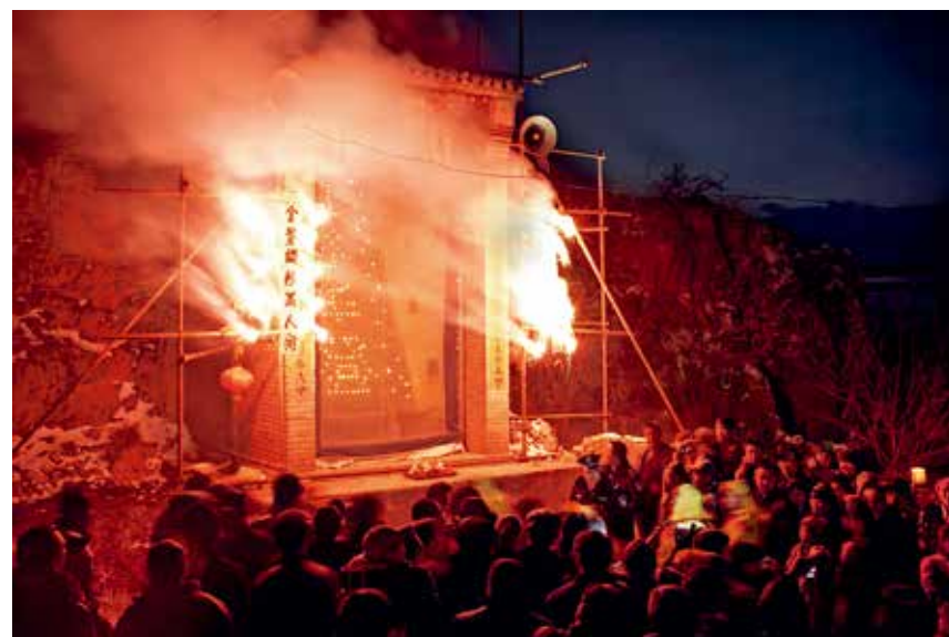
夜幕降临，众人叩首拜灯，点放烟花使拜灯山活动进入了高潮

点杆“祭雷神” 以长长的直立木杆（现为铁杆）为主杆，捆绑数根横担，平年12层，闰年13层。