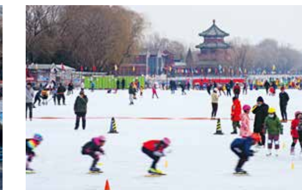
冰上小童星