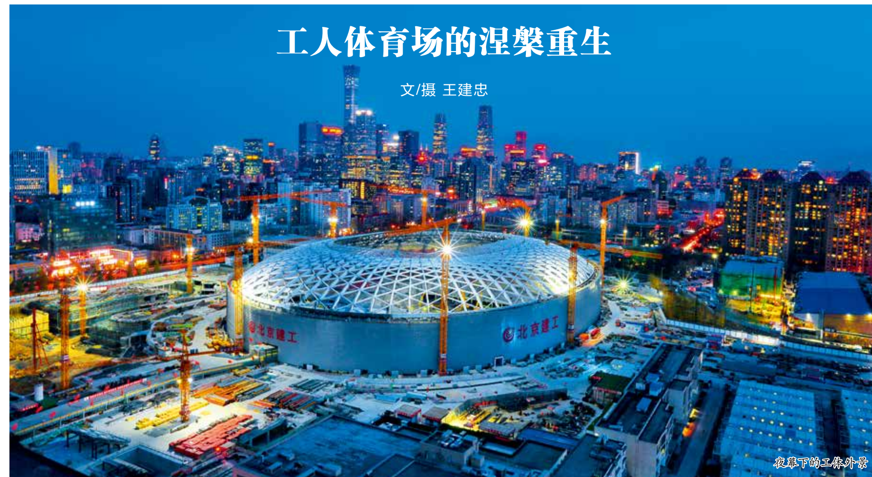
夜幕下的工体外景

浇筑完第一块混凝土、立起第一台塔吊、提升完第一根钢梁、安装上第一排座椅……无数个第一次的喜悦,激励着我不知疲倦的身躯,催促着我记录下北京工人体育场涅槃重生的辉煌历程。