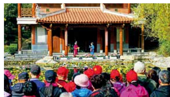
园林与戏曲的深度融合