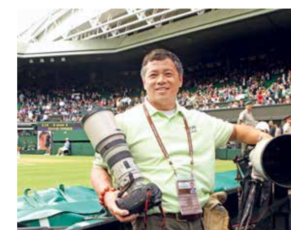
2012年，作者在伦敦温网采访现场

“没有人会一直赢下去”的魅力。这一天以后的费德勒，虽然不再是赛场上的焦点，但他却为全世界的球迷们留下了一段难忘的传奇。如同当年那个在巴塞罗纳公开赛担任球童的13岁男孩，在经历了一场不可思议的冒险之后，又将开启人生另一段未知的旅程。