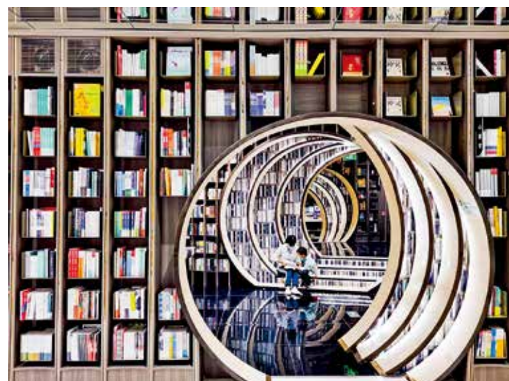
疫情期期间,一对母子遨游在钟书阁的书海之中,享受读书的快乐和惬意的亲子时光。