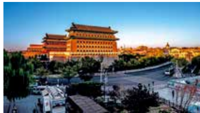
前门大街“正阳门”双楼