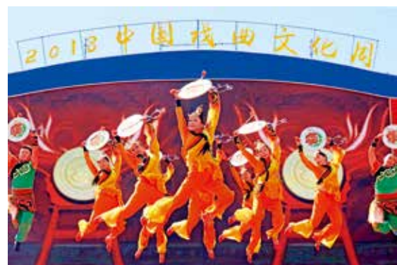
京西太平鼓亮相戏曲文化周