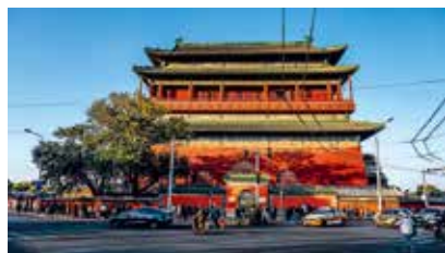
车水马龙“鼓楼”前街