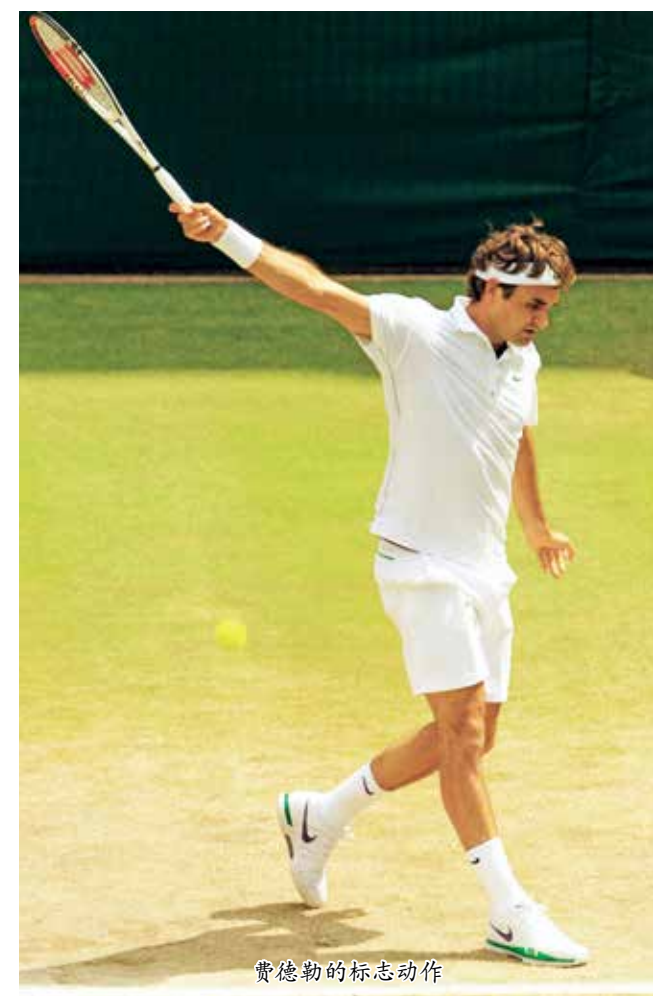
费德勒的标志性动作