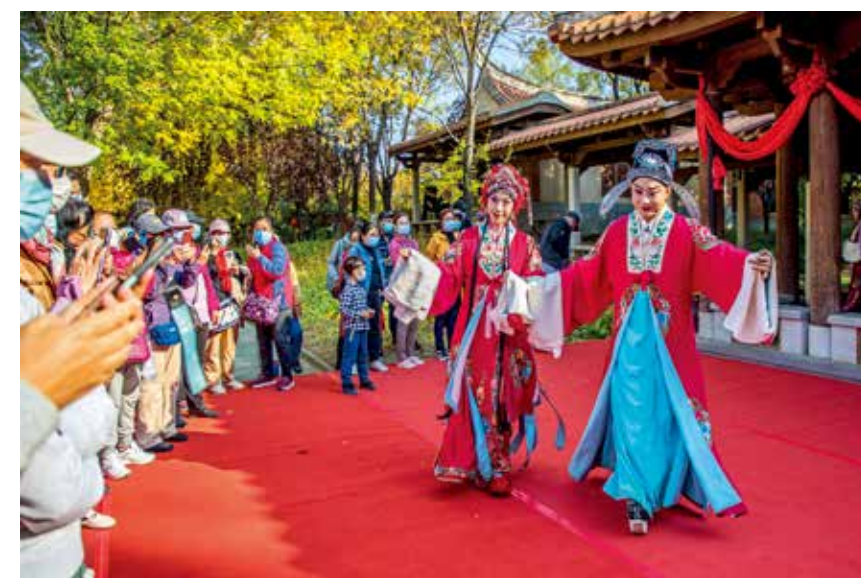
园博园里,艺术家们正在表演经典剧目《花为媒》。园林版沉浸式的精彩演出,让观众真正领略到了传统评剧艺术的独特魅力。