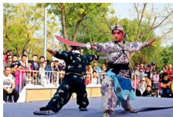
戏曲表演后继有人