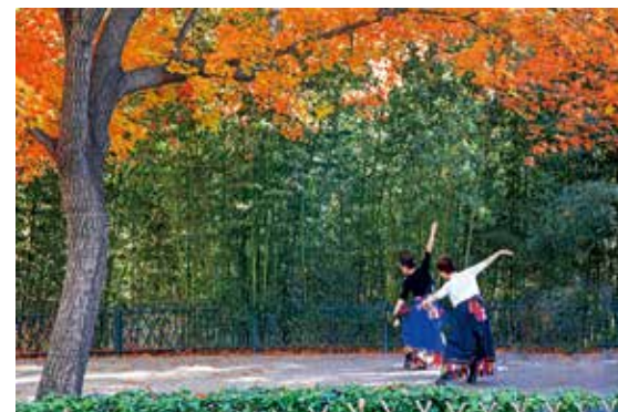
竹林前,红叶下,两位身着藏服的姑娘翩翩起舞,优美的舞姿惹人注目。