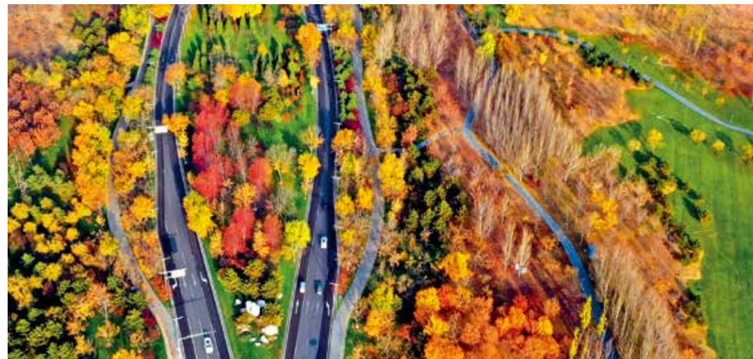
范崎路是雁栖湖国际都会都重要的交通路线,每到秋季五角枫、黄栌、银杏等色彩斑斓,成了一道流动的风景。