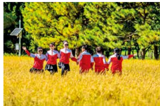
十月中旬,北坞公园里金灿灿的稻谷即将开镰,人们跳起了欢乐的舞蹈,欢庆丰收。