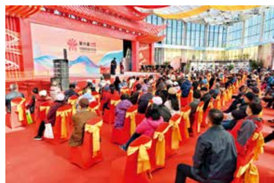
第六届中国戏曲文化周开幕