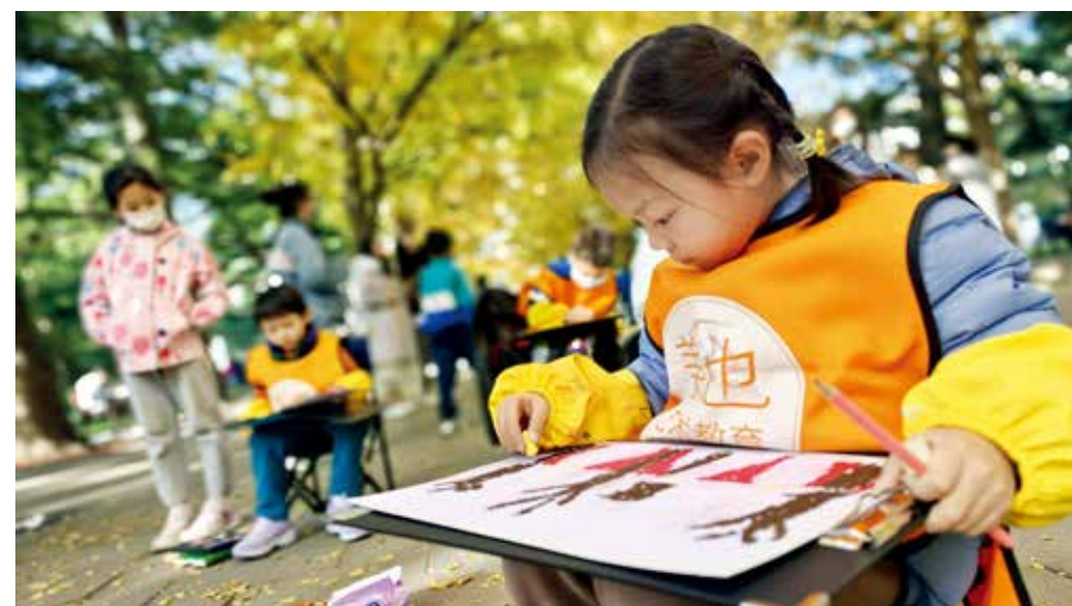
金秋时节,孩子们在中山公园“五色土”前的银杏大道上,尽情描绘心中美丽的秋天。