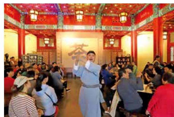
北京京剧经典《茶馆》让观众身临其境

中国戏曲起源于上古时代用来娱神的原始歌舞，是中国独具特色的传统艺术，与古希腊戏剧、古印度梵剧并誉为世界三大古老戏剧文化。中国戏曲的发展历史，萌芽自先秦，繁荣于明清，经过千年的发展演变，最终形成了以京剧、越剧、黄梅戏、评剧、豫剧五大戏曲剧种为核心的中华戏曲百花苑，历久弥香。