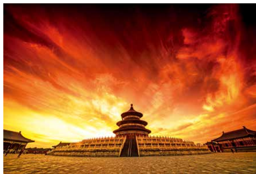
秋日傍晚,在红色晚霞的映衬下,天坛显得更加大气磅礴,京城的古都风韵呼之欲出。