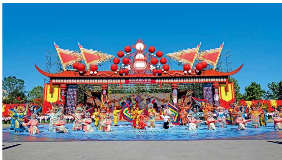
第二届中国戏曲文化周开幕式现场

中国戏曲文化周每年举办一届，历届活动皆在北京园博园举行，编织了戏曲与园林的迷幻情景，并以不同剧种的融合呈现、多种活动的联合开展营造出了嘉年华的热闹氛围，可谓届届精彩、各有亮点。2022年，第六届中国戏曲文化周于11月4日至10日上演，秋日园林的迷人魅力与舞台之上的精彩演出相映生辉。悠扬的琴声仿佛跨越了千年在耳畔回响，婉转的唱腔好似时光的低语，让人在入戏与出戏间如同穿越历史，恍然不知今夕何夕。