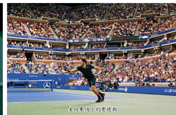
美网赛场上的费德勒