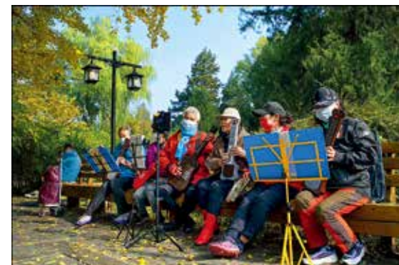
陶然亭公园里,几位老人正在演奏《我不想说再见》,清脆而带有和弦的的电吉他琴声奏响了丰富多彩的晚年生活。