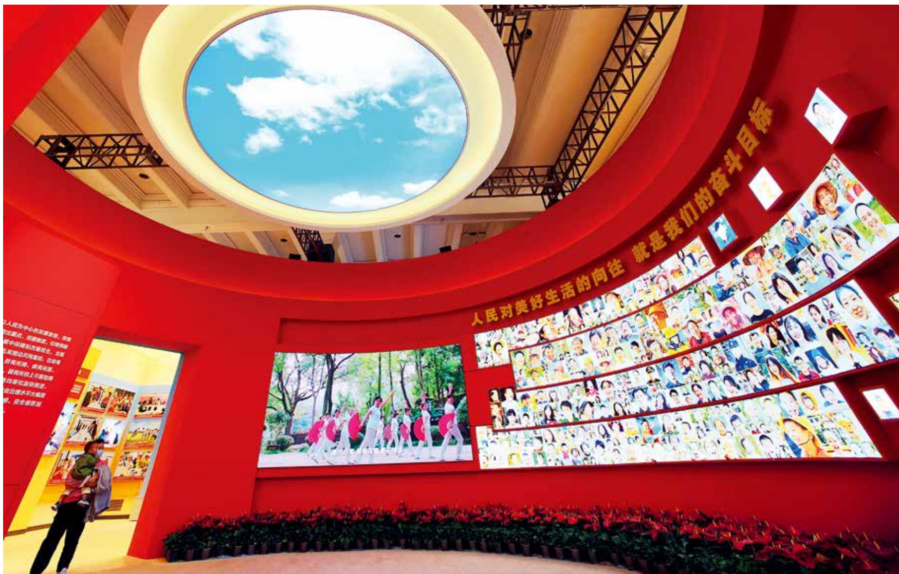
二十大召开前夕，“奋进新时代”主题成就展在北京展览馆开幕，集中展现了党和国家发展进程中极不寻常、极不平凡的十年。自10月31日起，公众可通过预约免费参观。