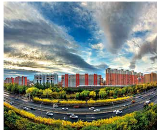
某日早晨,莲石路上空出现了大片斜射云。浓郁的秋色里,街头上车水马龙,一组动车疾驰而过。