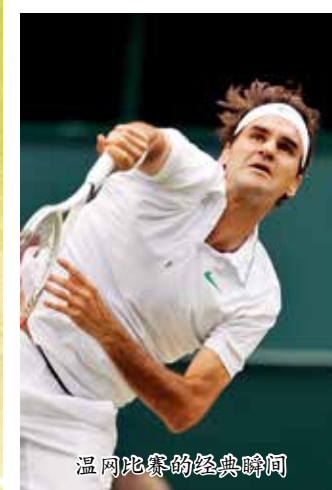
温网比赛的经典瞬间