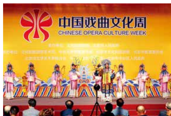
京剧名家胡文阁表演《贵妃醉酒》