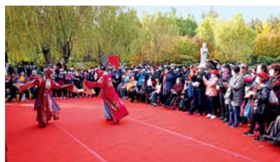
戏曲艺术走进生活