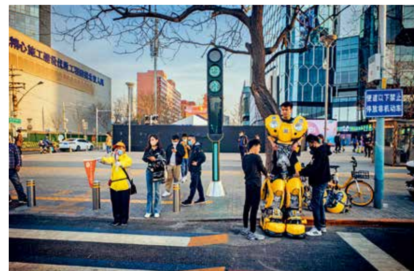
三等奖《23秒-北京现代与日常传统之间的通道》苏善书(法国)

S型曲折的街头雕塑充满画面, 两个行人分坐左右, 画面很均衡, 背景建筑幕墙上的“请就坐”的中英文提示非常醒目, 起到了点明主题和稳定画面的作用, 透着一种轻松幽默的意味。