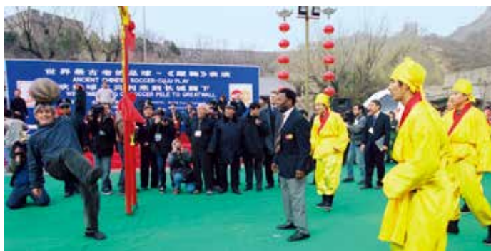
贝利和米卢的蹴鞠之战