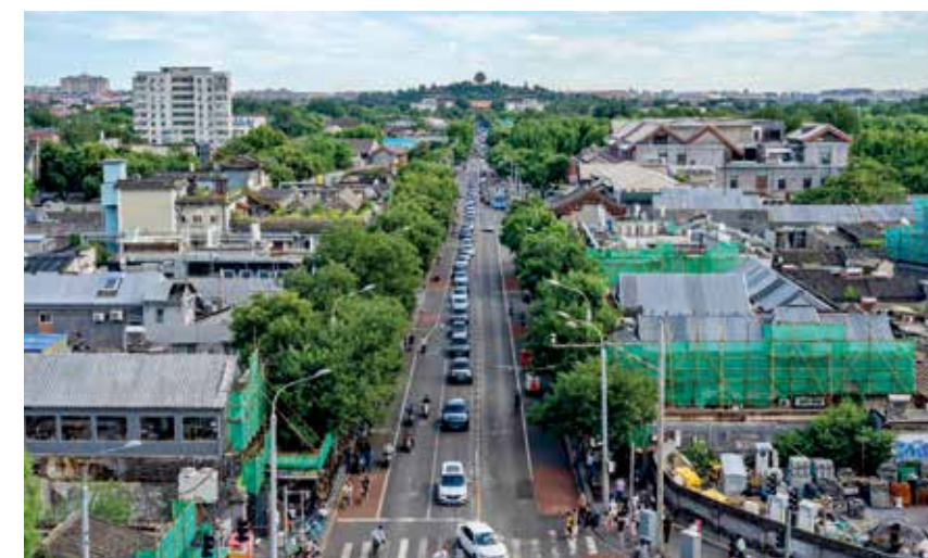
在修缮的过程中,一些违建进行了腾退,主要集中在钟鼓楼周边。