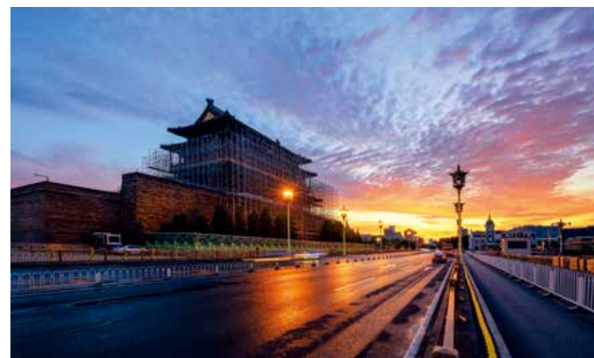
2020年3月,修缮中的正阳门箭楼。