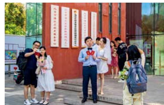
2022年9月9日是个好日子，海淀区民政局婚姻登记分中心迎来了上百对情侣登记结婚，喜在脸上，甜在心里。