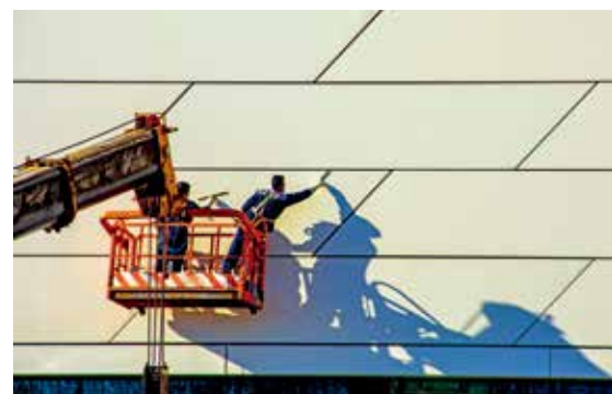
两名建设者正在清理国家会议中心外墙，阳光将他们劳动的身姿投射在建筑外立面上，构成了一幅美丽的劳动图景。