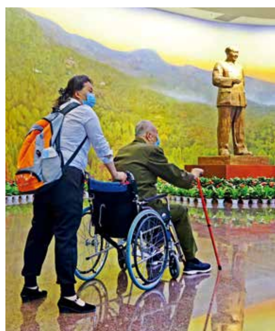
轮椅上的老将军，又回到了日思夜念的革命圣地香山。