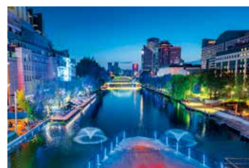
迷人的亮马河夜景