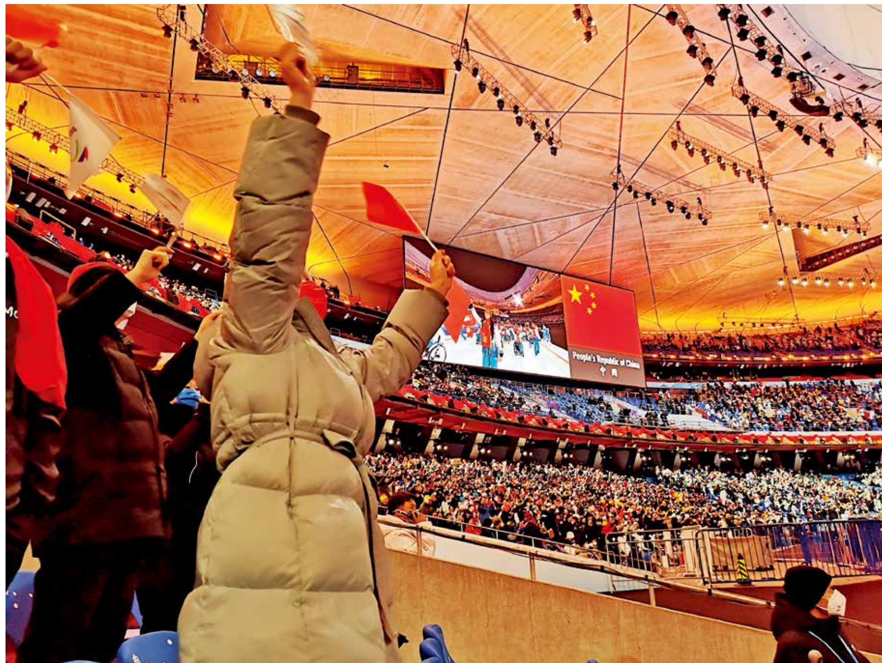
一等奖《冬残奥会开幕式-为参赛者欢呼!》黄秀敏(马来西亚)

冬残奥开幕式现场令人心潮澎湃, 当中国运动员手举国旗昂首阔步进入会场, 立即成为众目的焦点。作者巧妙地运用了前景中欢呼的人物与远景中的五星红旗, 和大屏幕中的中国代表团相呼应, 形成结构性布局, 赋予了画面一种昂扬的情绪, 突出了欢庆冬奥的主题。