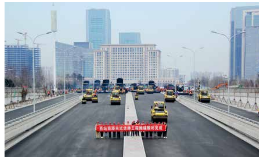
交通畅达是城市发展的硬条件，近年丰台区的道路越修越宽广，首都高质量发展不断向前推进。