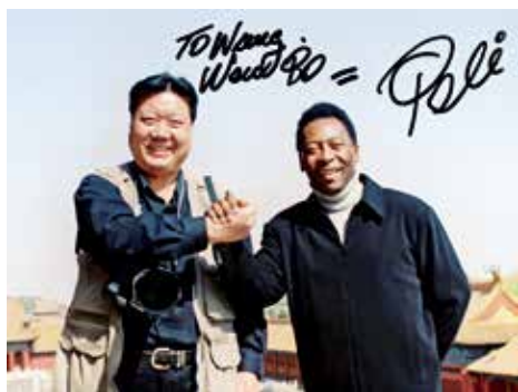
作者和贝利的合影

光阴荏苒，八年后的2010年，贝利在巴西圣保罗的家中再次看到当年我和他在故宫的合影照片时，非常高兴地在照片上签了名，还把一个签了名的足球送给我，我们成为了很好的朋友。如今，世界足坛虽已诞生了多位巨星，但贝利仍是世界球迷心目中永远的英雄。