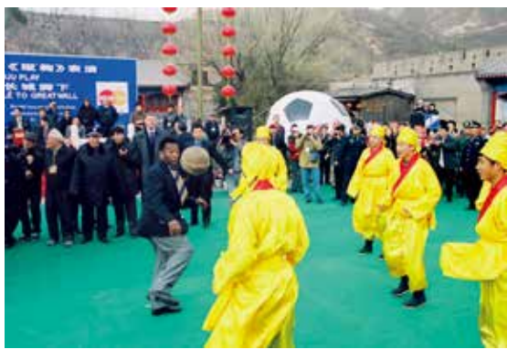
外脚蹴鞠可谓一绝