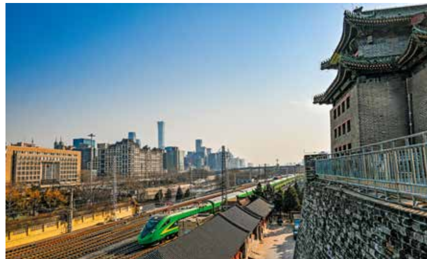
古城墙与CBD遥相呼应，一辆复兴号高铁列车从城墙边疾驰而过，带着我们的希望，向着远方，向着明天。