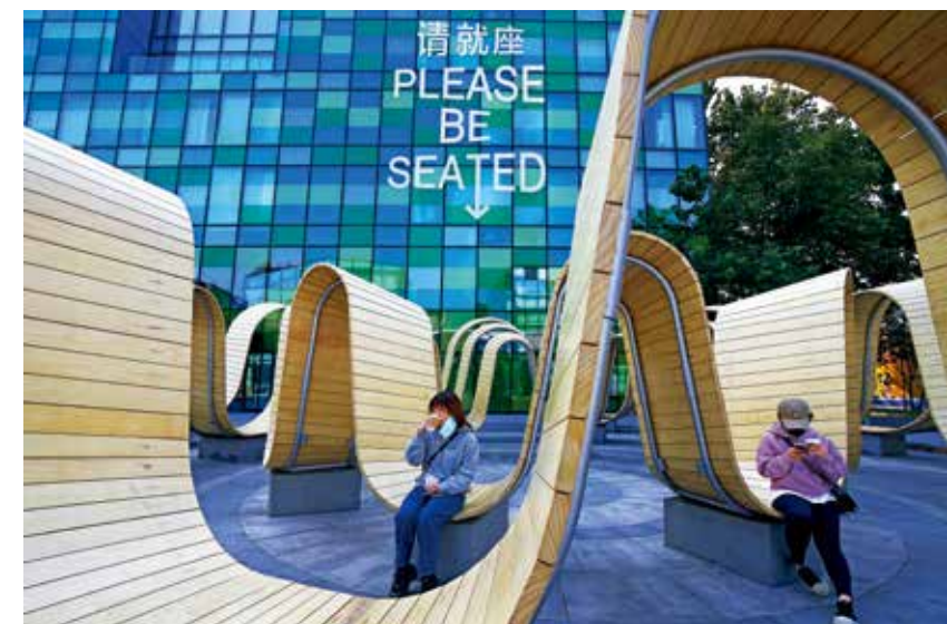
三等奖《请就坐》乔治·杜帕斯(希腊)

这幅作品以光影的独特把控表现取胜。黄昏的光线柔和又温暖, 主体建筑突出, 逆光下景物细节依稀可辨, 合理的曝光增加了画面的层次感和透视感, 荡漾的水波为宁静的画面增添了灵动。