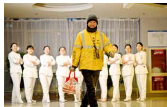
首钢医院里，一位外卖小哥突然闯入镜头，成为了新的焦点，纯朴、自然、乐观的笑容定格在瞬间。