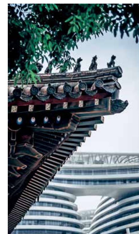
优秀奖《展望, 回眸》迈克尔·卡德(英国)

透过玻璃窗看到满眼的璀璨灯光如童话世界, 画面丰满, 氛围热烈。在疫情防控时期北京的夜经济繁荣依旧, 反映了人们对美好生活的向往和追求。