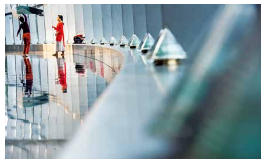
普通百姓在大剧院一角翩翩起舞，体现了人们的艺术素养在不断提高，以及人们对精神生活的追求。