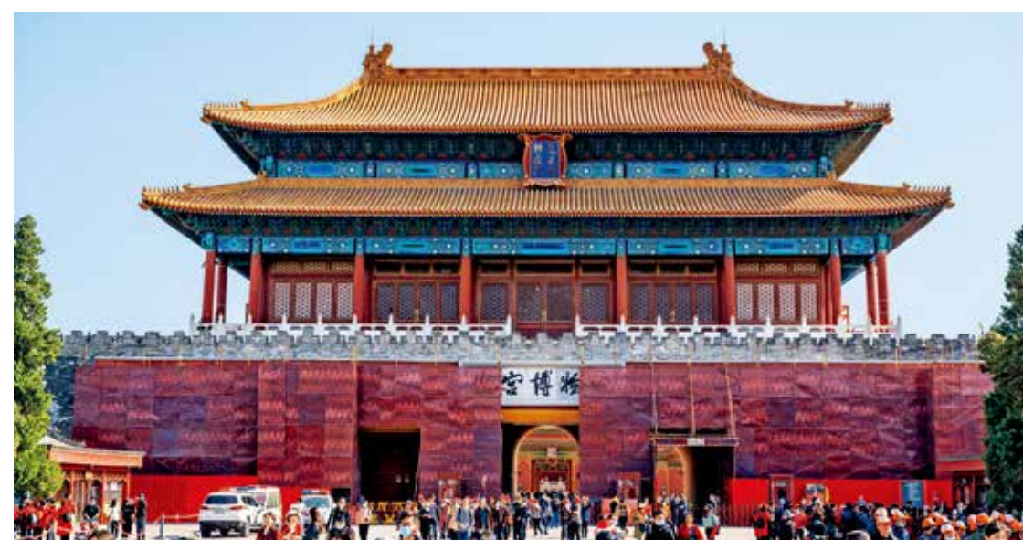
2021年初,在中轴线申遗的冲刺阶段,故宫及钟鼓楼等主要建筑迎来了一次大面积的修缮。①为故宫神武门,②为故宫午门,③为故宫东华门,④为钟楼。