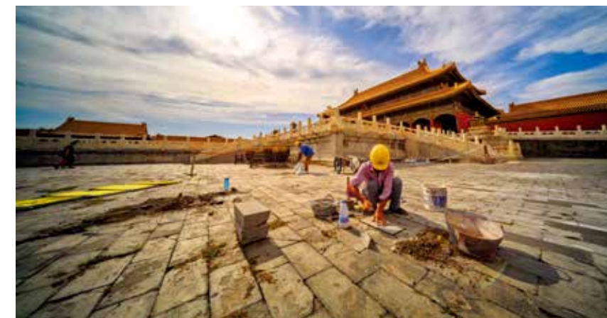
2019年,故宫没有开展大面积的地砖修缮,但一直在进行有针对性的小范围修补。9月,工作人员正在修缮乾清宫。