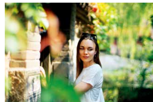
优秀奖《着迷于美丽胡同的姑娘》康斯坦丁·列夫金(俄罗斯)

作品采用仰拍大兴机场建筑造型奇异的内景, 构图奇特。画面中复杂的线条富于变化, 显得很流畅又超现实, 同时扭曲的线条簇拥着通透的网格状窗, 也使得画面有了灵动的感觉。仰拍更突出了这种视觉感。