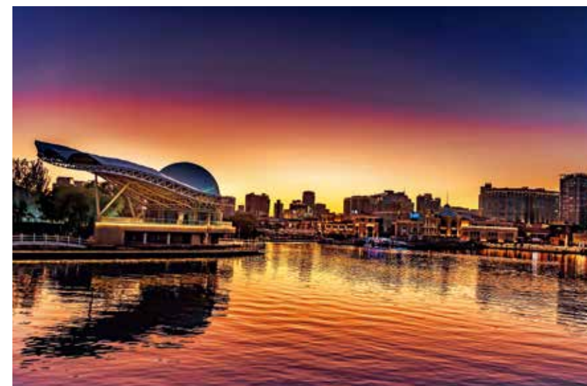
二等奖《落日下的明珠》穆巴(埃及)

画面整体氛围十分热烈, 天安门前国旗迎风招展, 广场中央的巨型花篮上“祝福祖国”标语点明了主题, 虽拍摄的是人们的背影, 但从纷纷高举的手机和专注的形态, 看得出人们对祖国的热爱之情和衷心祝愿。画面赋予的是一种情感、一种感受, 含蓄而深刻富有感染力。