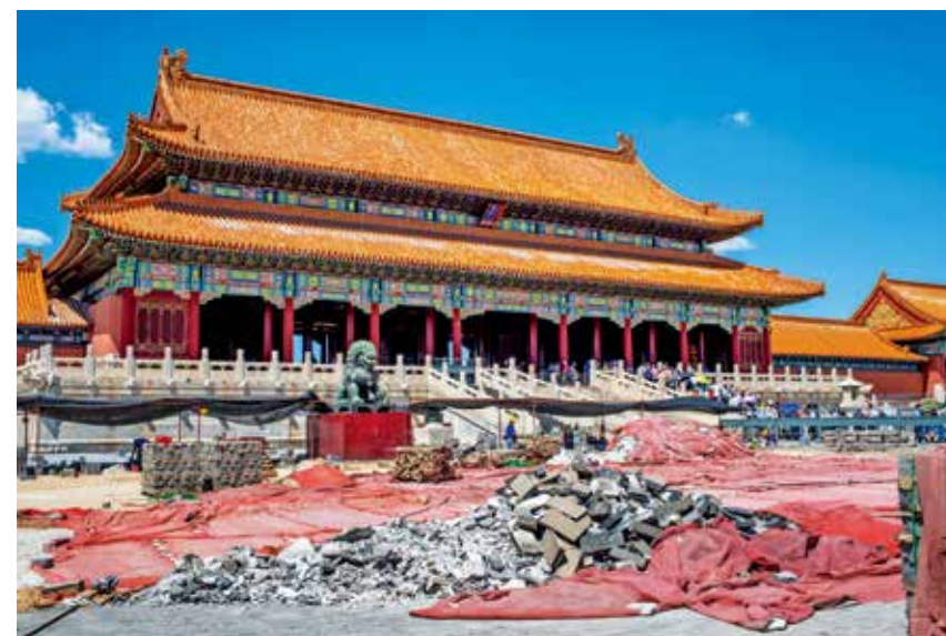
故宫是中轴线上最重要、最大的古建筑群之一,修缮次数最多,修缮规模也最大。2018年5月,金水桥的地砖和午门的城墙进行了大面积修缮。