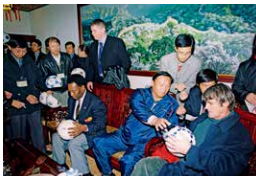
贝利和米卢为球迷签名