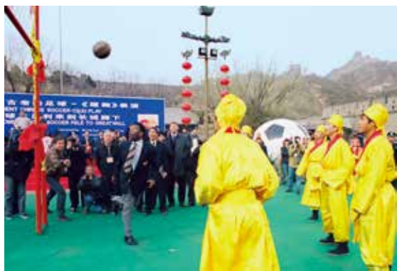
贝利的倒踢看得人目瞪口呆