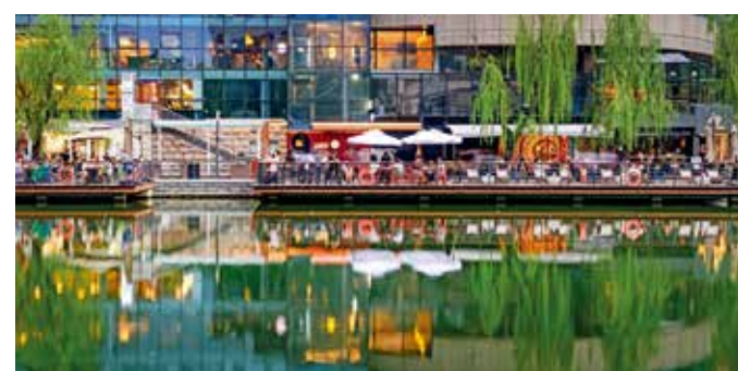
亮马河岸的多彩生活