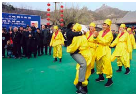
贝利情不自禁地抱住队员庆祝赢球