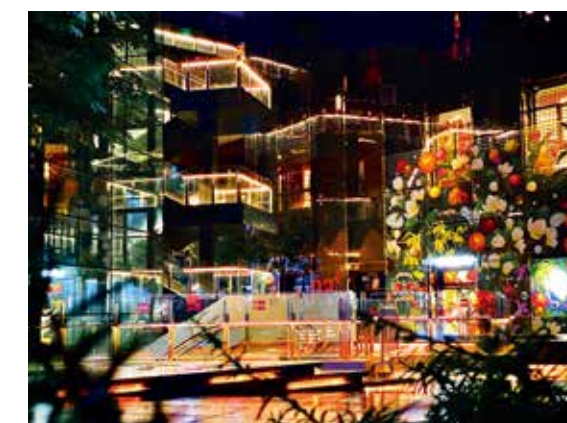
优秀奖《繁华夜景》马赛(塔吉克斯坦)

北京的胡同是那么地迷人, 运用大光圈、小景深虚化前景和背景, 尽管使胡同里很有特色的门楼砖雕有些虚化, 但更衬托突出了姑娘的神情, 同时也不失老北京民居的魅力体现。