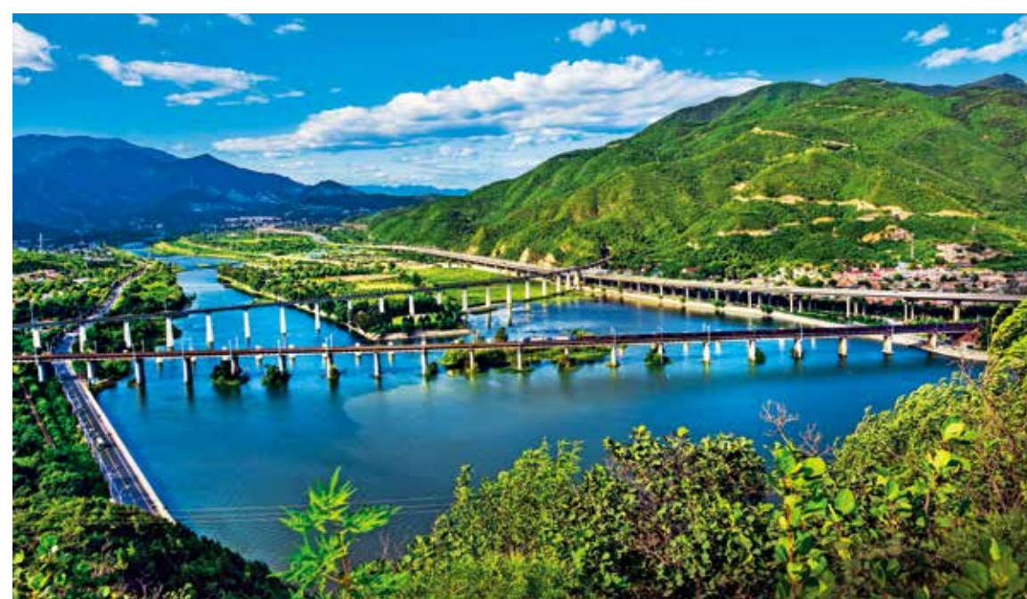
京西古镇附近的三家店水闸大桥横跨永定河，辅以绿水青山、蓝天白云，犹如藏家的纳木错架上了现代化大桥，美丽而庄重。