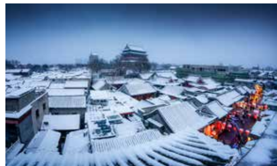
雪后的鼓楼