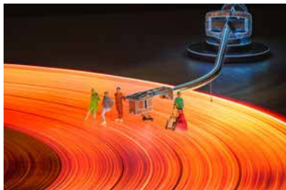
高光时刻