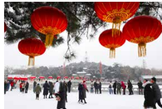
瑞雪迎春