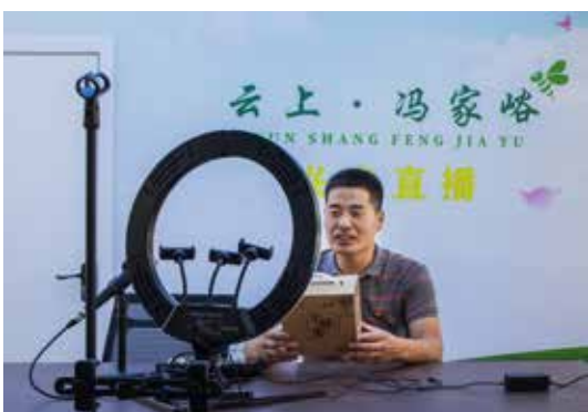
村书记直播