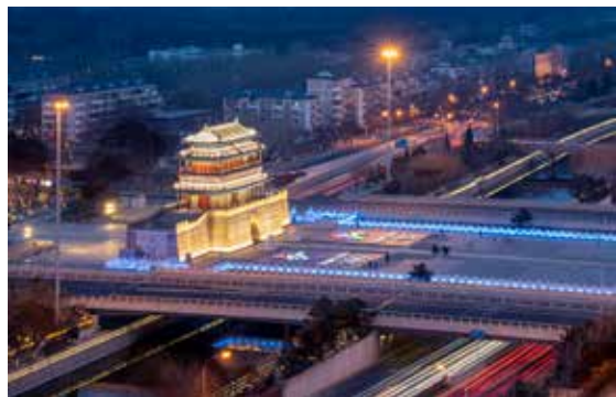
古城庆冬奥