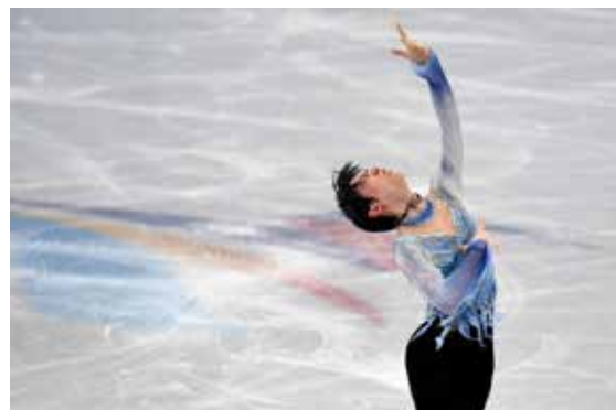
羽生结弦北京冬奥首秀