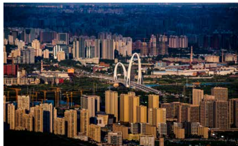
京西大门