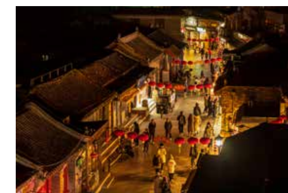
大红灯笼高高挂