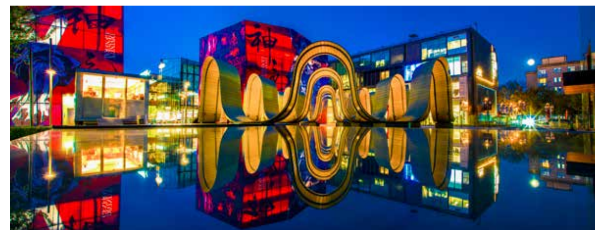
城市新景观

宴。阅读的光芒透过心灵的窗户，照亮了人们的生活。繁华的北京，是绵延远方的车水马龙与川流不息，更是一座充满文化韵味、精彩永不落幕的魅力之城。