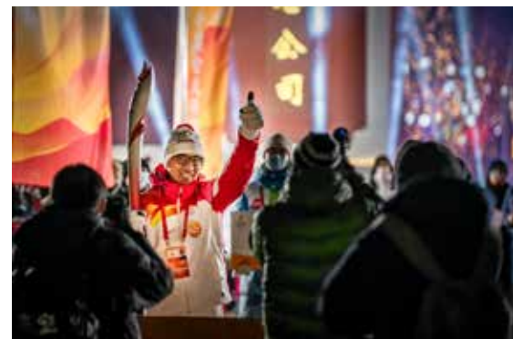
神圣的使命