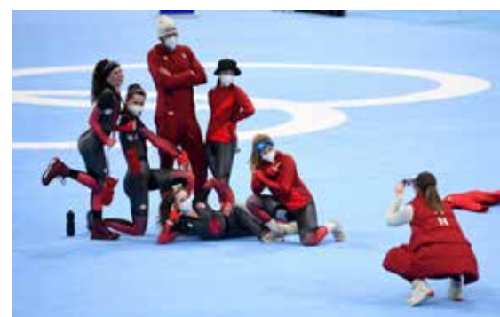
冬奥速滑馆拍照留念