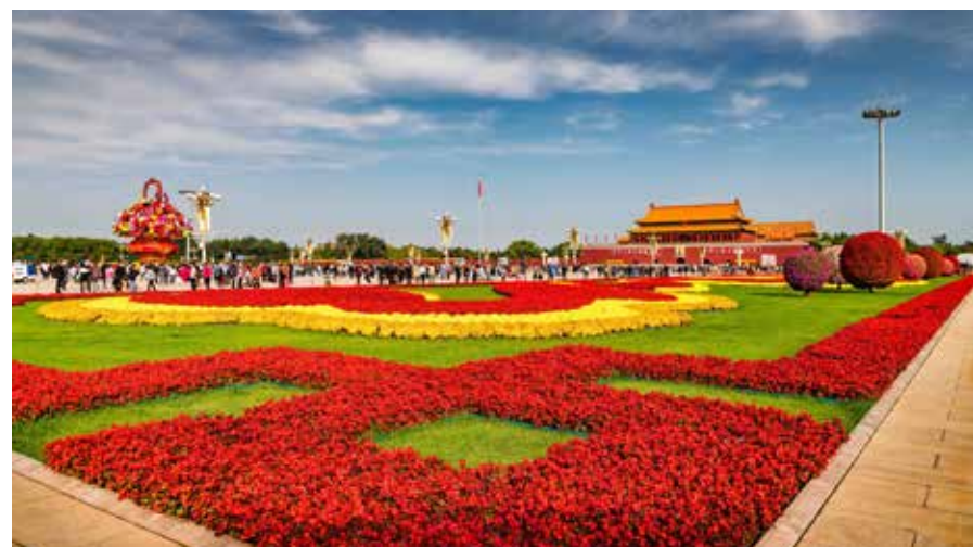
鲜花妆扮