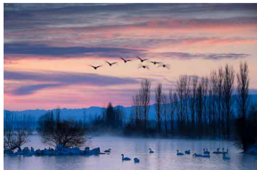
彩霞映照天鹅泉