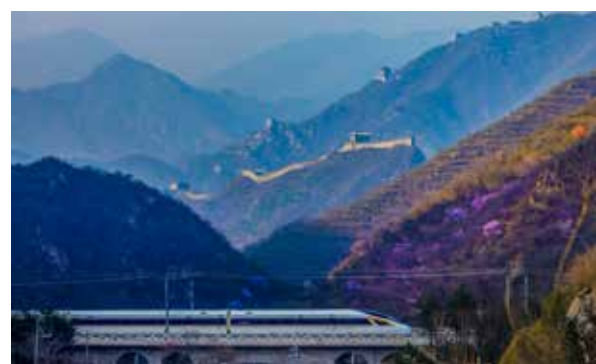
开往春天的复兴号