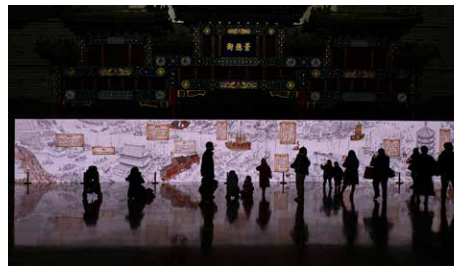
历史画廊