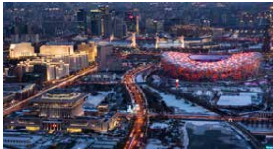
冬奥夜色