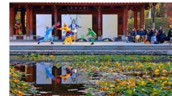
戏到深处