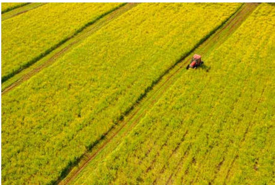
花海耕耘