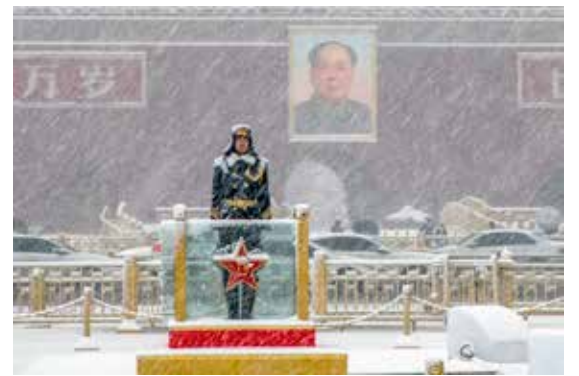
忠于职守

壮丽的身姿，与雄安新区共同形成的两翼正待挥舞翱翔，助力京津冀协同发展的美好未来。眺望各大重点工程现场，钢架铁臂直抵云霄，彰显出北京城市发展的无限活力。其间的建设者，连同各行各业为梦想而奋斗的人们，犹如一朵朵澎湃的浪花汇聚成新时代的洪流。在北京的怀抱，人们热情地建设她，也享受着城市发展的累累硕果。