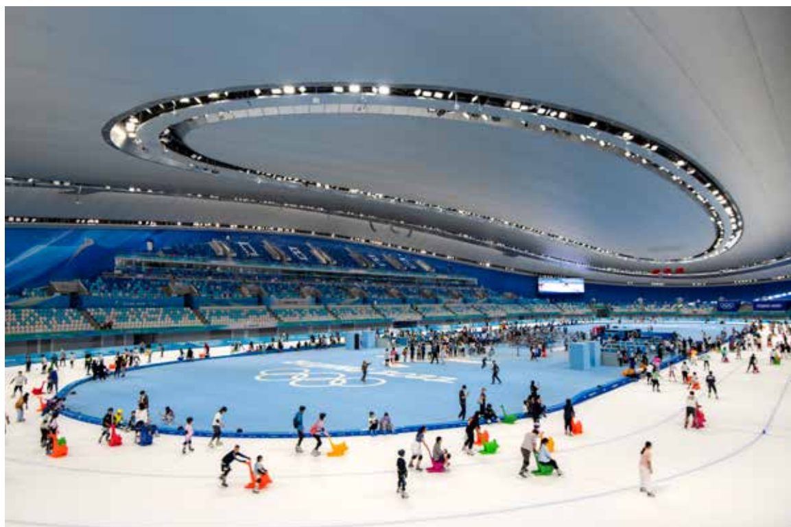
全民乐享冰丝带 健康生活动起来