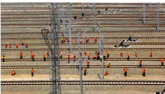
铁路工人协奏曲