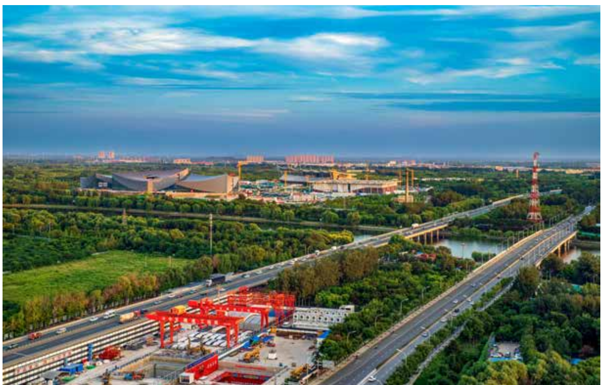
副中心四大工程