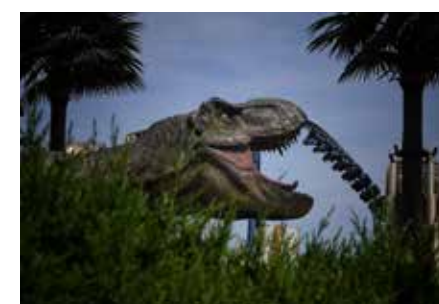
北京环球影城重启开放 (组照)