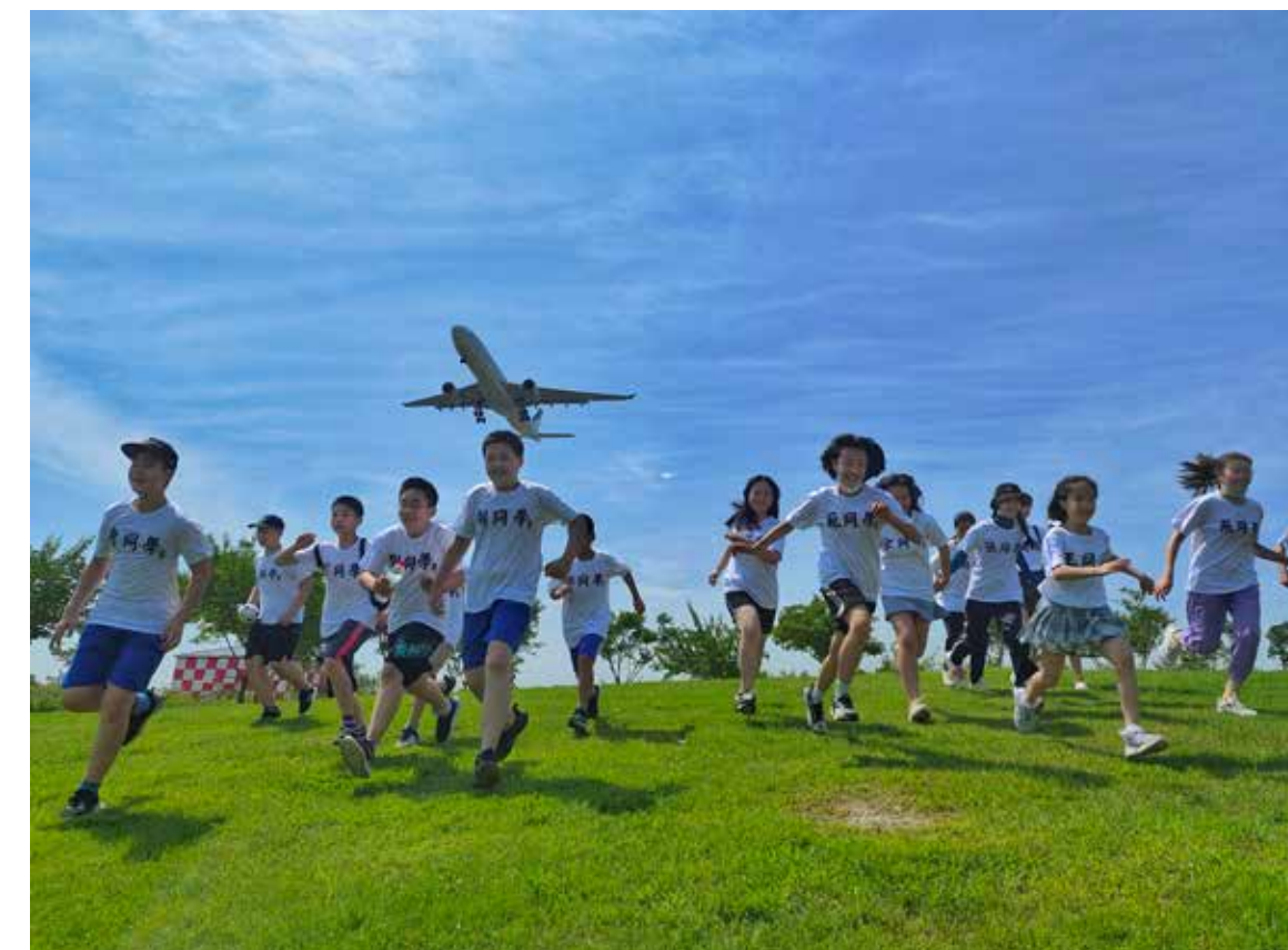
奔跑吧少年