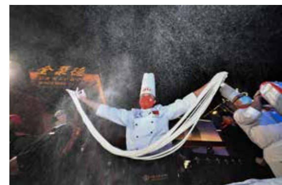
北京消费季启动