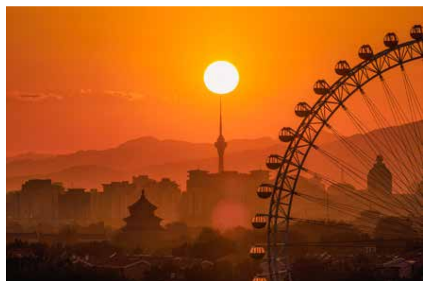
太阳落日映照摩天轮