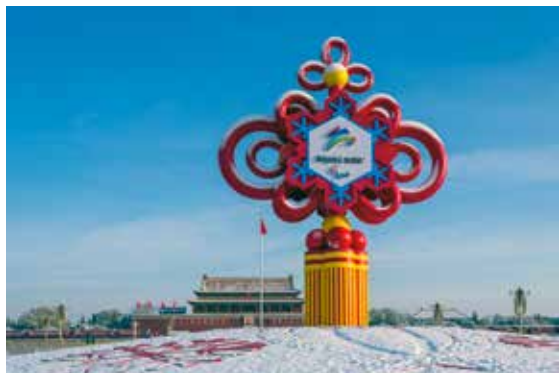
共结同心 梦圆冬残奥

2022年，北京成功举办冬奥会和冬残奥会，成为世界上首个双奥之城。从赛事的全面准备、优质的综合服务保障，到备受全球关注的比赛盛况、全民冰雪运动的持续发展，冬奥彰显了北京日益提升的影响力和知名度，为我们留下了深刻的冬奥记忆。这份记忆，将载入北京城市发展的史册，成为北京不断走向世界舞台中央的闪亮标记。