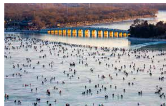
昆明湖大冰场