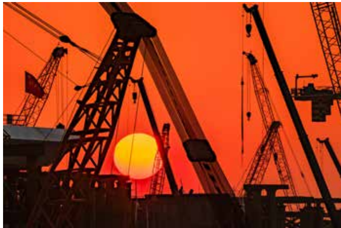
永定河新地标