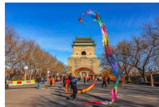
祥龙越上钟鼓楼