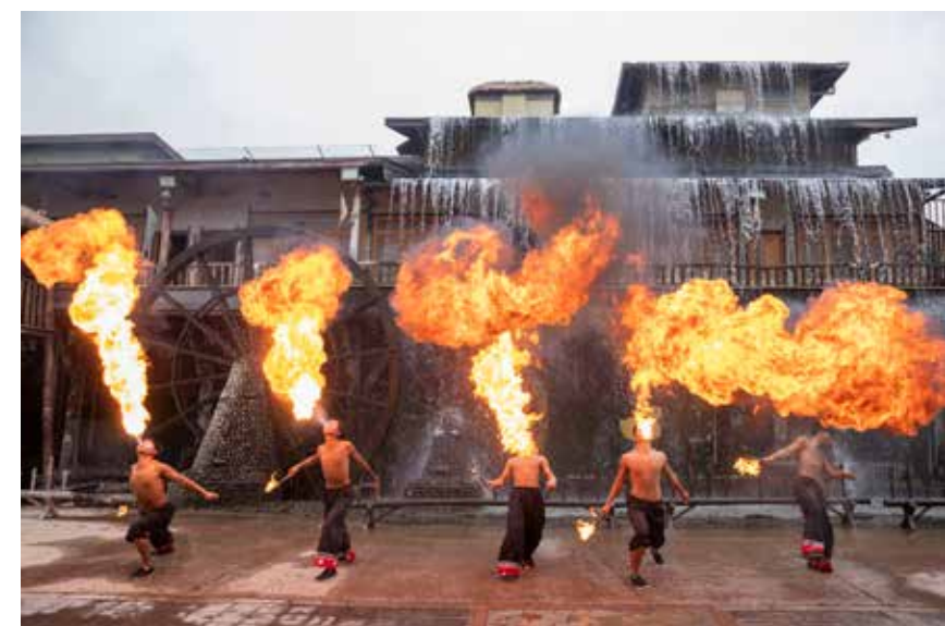
呀路古民俗表演