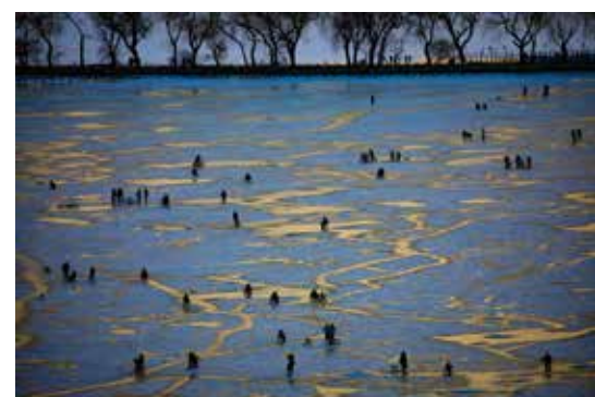
颐和冬季