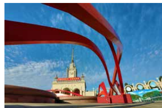
“奋进新时代”成就展亮相