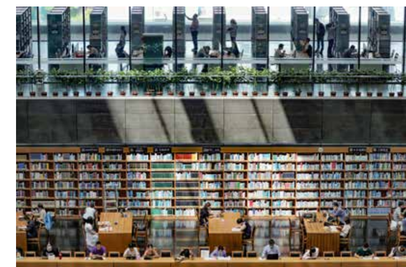
徜徉在知识的海洋