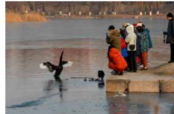
人与自然