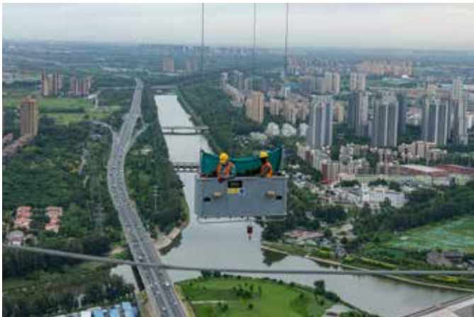
我心中的运河