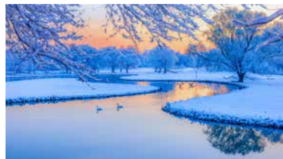
京郊春雪