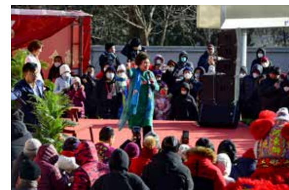
评书大师刘兰芳