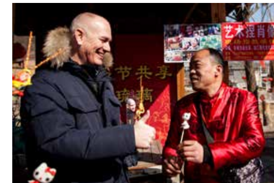
点赞收藏