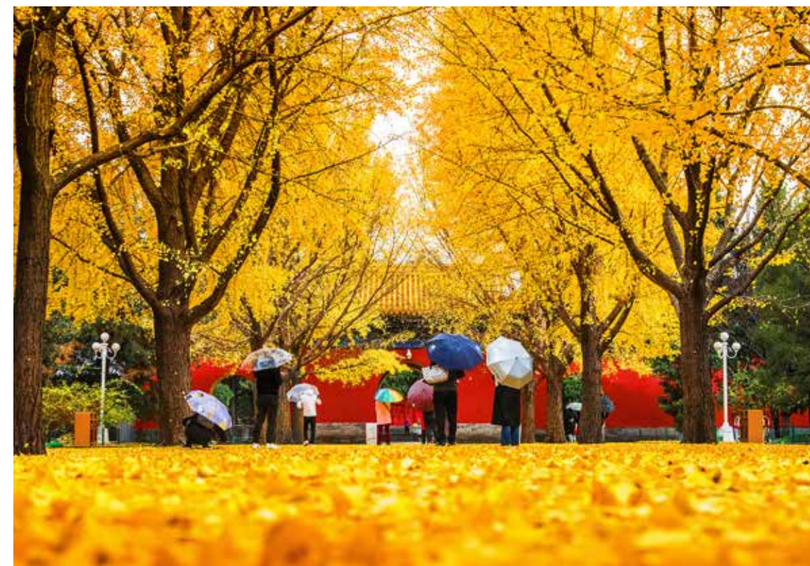
名园秋韵