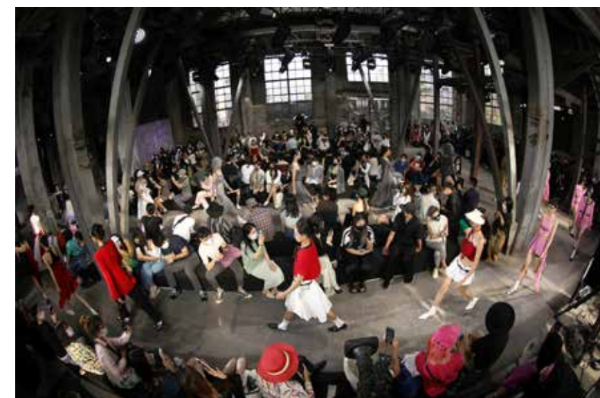
昔日大车间 今朝秀场