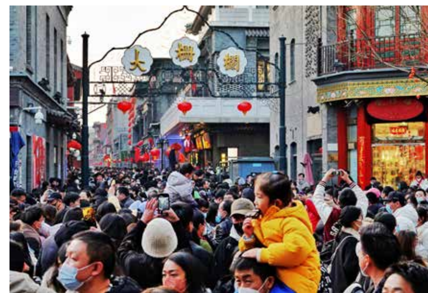
过大年(组照)